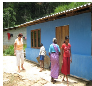
Werken aan een droog dak boven je hoofd